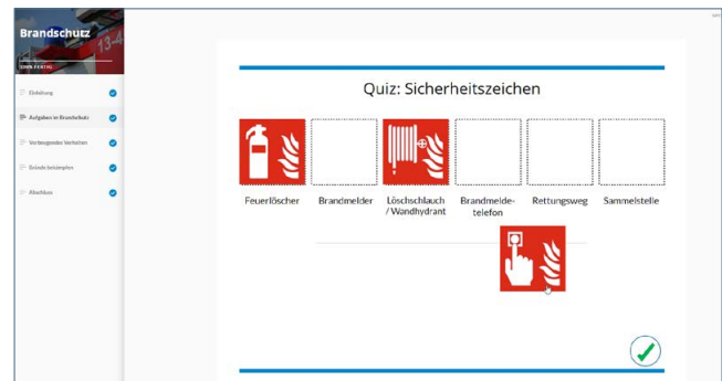
Brandschutz: Wissenstests fördern das aktive Mitmachen